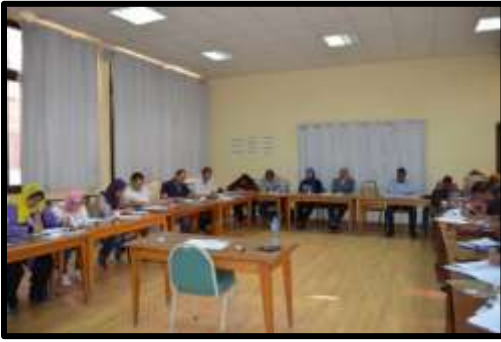
دورة " لغة إنجليزية مجموعه (1) مستوى اول "