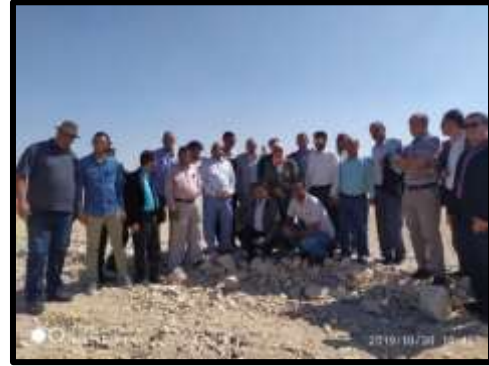
زيارة ميدانية لسد اعاقه ومخر سيل بقرية حجازة بمحافظة قنا