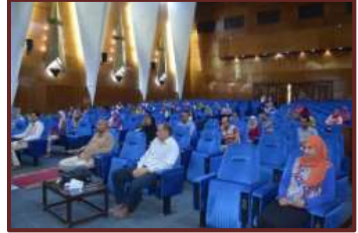
إختبار " تحديد مستوى اللغة الإنجليزية "