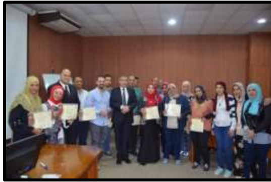
دورة " Adobe-Photoshop "