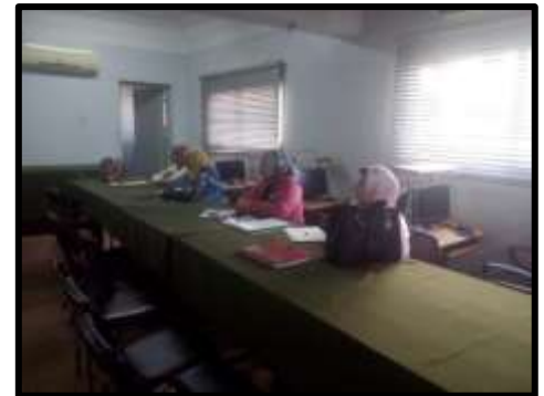
دورة " إعداد مدربين TOT فى مجال الشؤون التعاقدية "