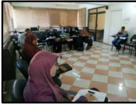
دورة " لغة انجليزية مستوى ثانى "