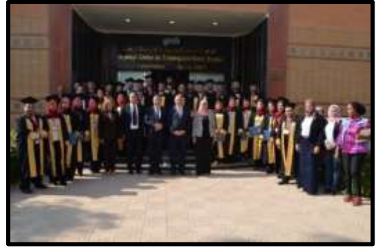
حفل ختام برنامج "إعداد القيادات الشبابية الإدارية"