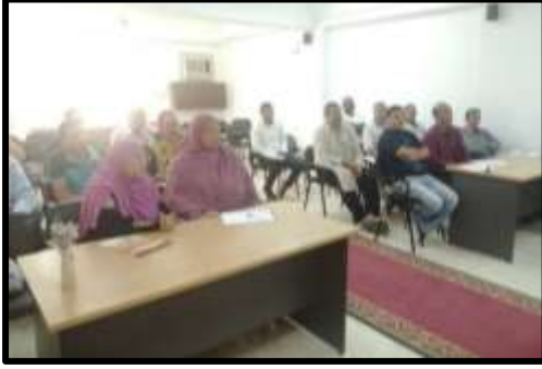
دورة " إعداد مندوبي حجز إدارى " (تدريب تحويلي)

○ تم تنفيذ عدد (3) نشاط تدريبي لعدد (57) متدرب.