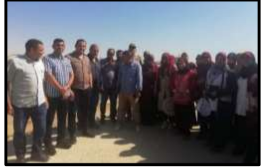
زيارة ميدانية لسحارة المحسمة بالإسماعيلية