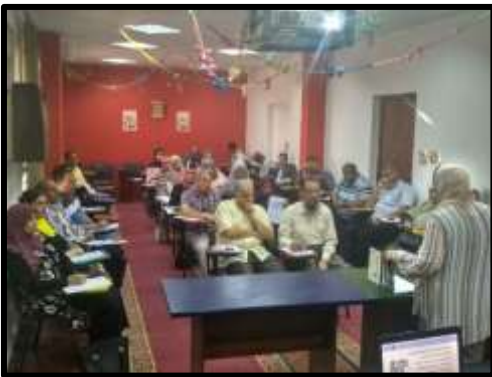
دورة " إعداد مدربين فى الشئون التعاقدية TOT (مستوى أول) "

○ تم تنفيذ عدد (4) نشاط تدريبي لعدد (109) متدرب.