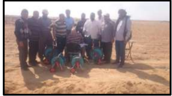
زيارة ميدانية لمنطقة الظهير الصحراوي لمدينة السادات