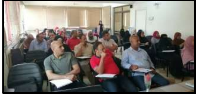
دورة " قوانين الري والصرف "