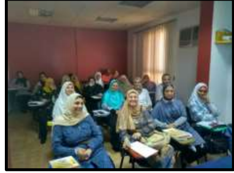
دورة " لغة انجليزية مستوى اول"