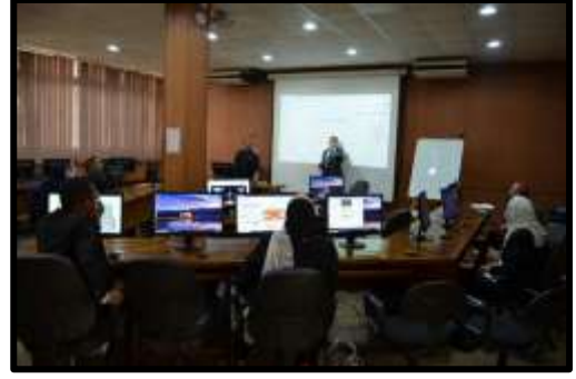
اختبارات المقابلات الشخصية لبرنامج اعداد القيادات الوسطى (مهندسين) دورة "إعداد القيادات الإدارية"