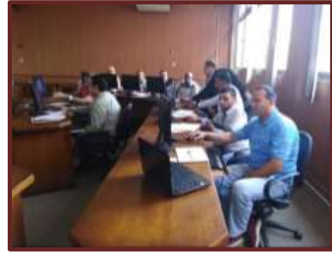
دورة " الرسم الهندسي باستخدام برنامج " AUTO CAD 2D "