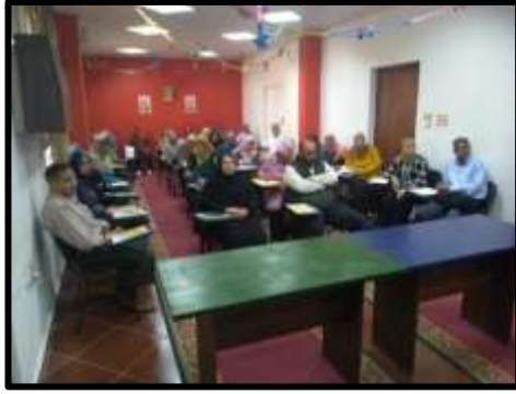
دورة "إدارة الأزمات"