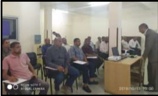
دورة " طرق الري الحديثة "

○ تم تنفيذ عدد (2) نشاط تدريبي لعدد (38) متدرب.