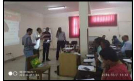
دورة " مهارات القيادة والإدارة والتميز الوظيفي "