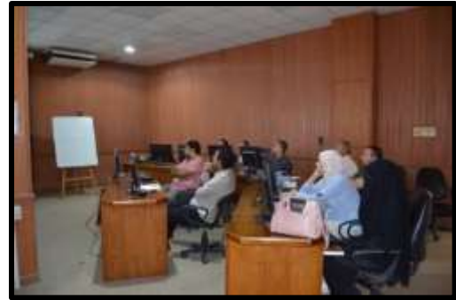
دورة " بناء النماذج الانشائية " Rivit Structure "