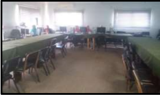
دورة " EXCEL "

○ تم تنفيذ عدد (4) نشاط تدريبي لعدد (69) متدرب.