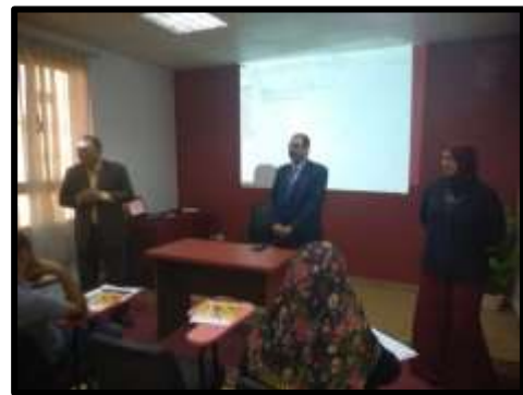
دورة " تراخيص الري و الصرف "