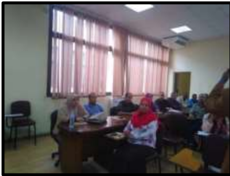
دورة " تطوير ذات واكتشاف القدرات "