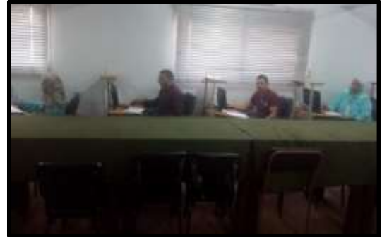
دورة " إعداد مراتبات بإستخدام برنامج الإكسل "