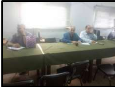
دورة " تراخيص الري والصراف "