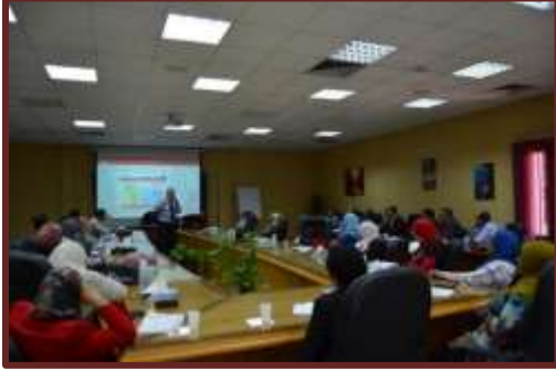
دورة " القيادة والتأثير وبناء الثقة والإتصال الفعال "

■ تم تنفيذ عدد (9) نشاط تدريبي لعدد (277) متدرب.