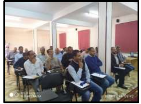
دورة "الشؤون التعاقدية -TOT- مستوى ثاني"