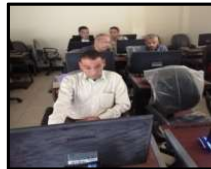
دورة " Auto Cad "