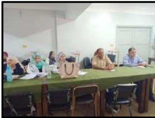
دورة "TOT" في مجال الشؤون التعاقدية "