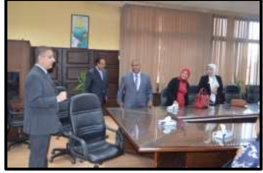
( المقابلات الشخصية لاختيار المرشحين لبرامج إعداد القيادات الوسطى للسادة المهندسين )