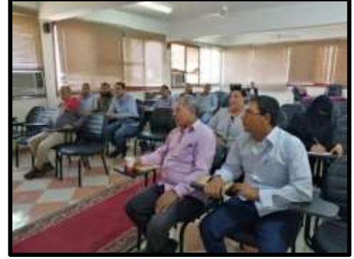
دورة " المخازن والمشتريات"