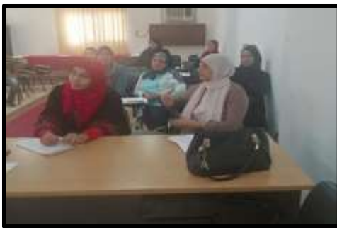
دورة " مهارات الاتصال الفعال و التفاوض و حل النزاع "

○ تم تنفيذ عدد (3) نشاط تدريبي لعدد (52) متدرب.