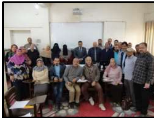
دورة " القيادة والإدارة والتميز الوظيفي"

○ تم تنفيذ عدد (3) نشاط تدريبي لعدد (70) متدرب.