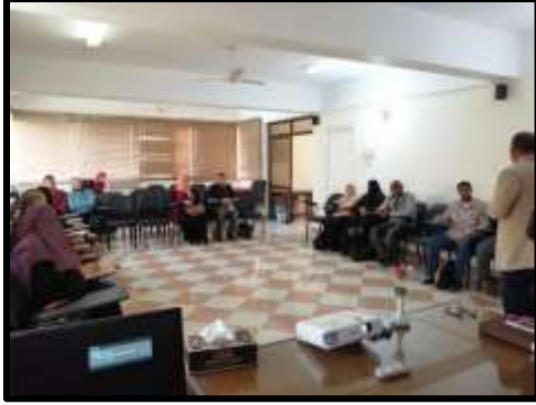
دورة " فن التعامل مع الرؤساء والمرؤسين والزملاء (مهارات الاتصال الفعال)"

○ تم تنفيذ عدد (2) نشاط تدريبي لعدد (43) متدرب.