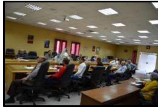
دورة " إدارة المشروعات " PMP