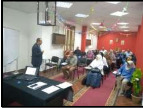
دورة "الشئون التعاقدية TOT - مستوى ثانى"

○ تم تنفيذ عدد (2) نشاط تدريبي لعدد (44) متدرب.