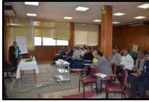
دورة " السلامة والصحة المهنية " OSHA