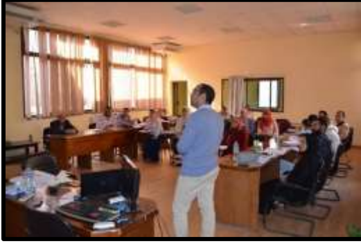
دورة " تكنولوجيا الاستشعار عن بعد باستخدام " ERDAS