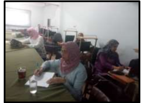
دورة " شبكات حاسب آلي "