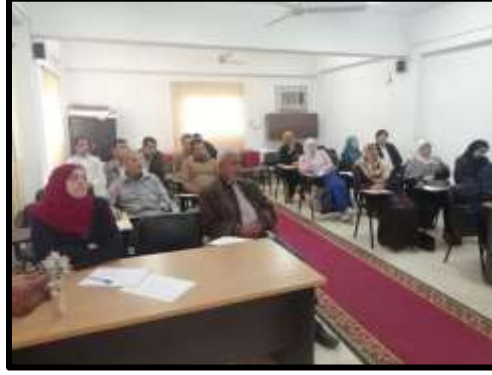
دورة " قانون تنظيم التعاقدات قانون ١٨٢ و لائحته التنفيذية"