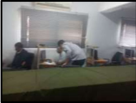
دورة " Auto CAD " مستوى ثاني

○ تم تنفيذ عدد (6) نشاط تدريبي لعدد (88) متدرب.