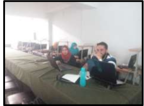
دورة " نظم المعلومات الجغرافية "