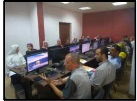
دورة " Advanced Excel"