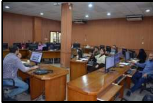
دورة "Revit structure" (المستوى الثاني)