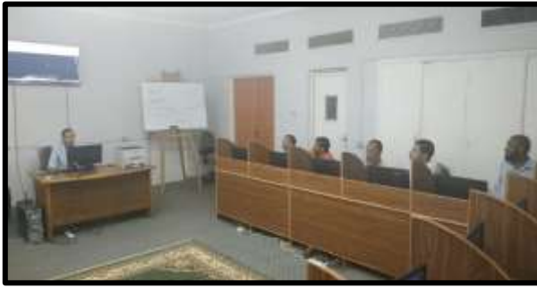
دورة "الرسم الهندسي باستخدام برنامج Auto cad 2d (مستوى اول)

○ تم تنفيذ عدد (5) نشاط تدريبي لعدد (101) متدرب.