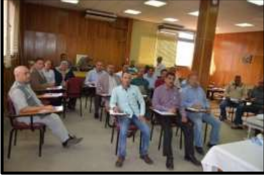
دورة "إعداد المرتبات طبقا لقانون ٨١ لسنة ٢٠١٦"

■ تم تنفيذ عدد (16) نشاط تدريبي لعدد (378) متدرب.