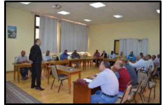
دورة "ادارة المخازن والمشتريات"