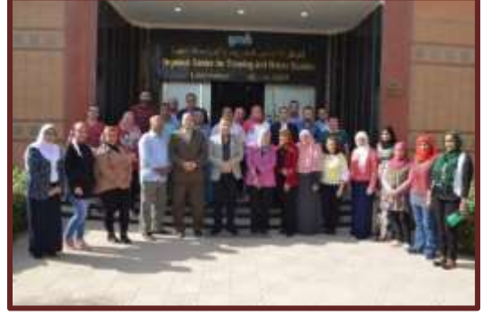
دورة "إعداد مدربين في الشؤون التعاقدية" TOT