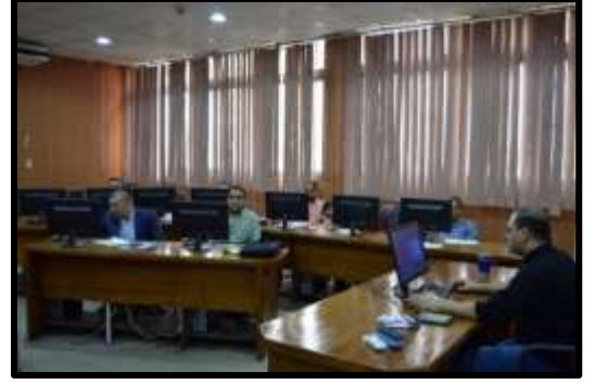
دورة "AUTO CAD 3D"